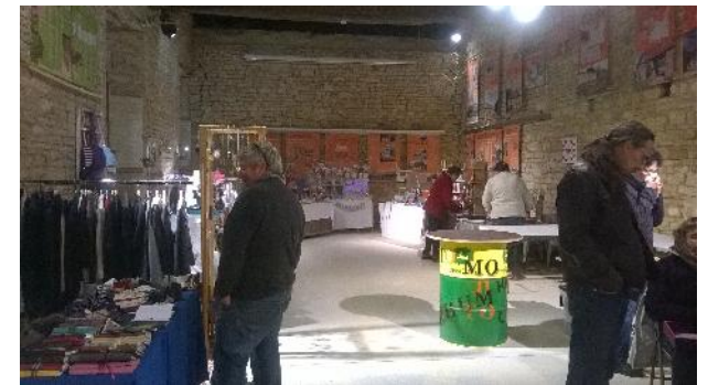
Salle des Gardes