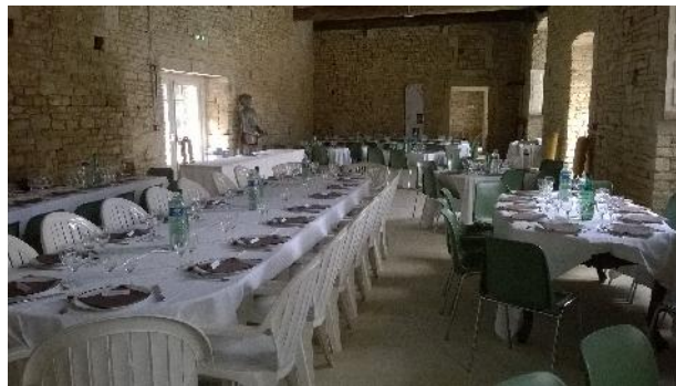
Salle des Gardes