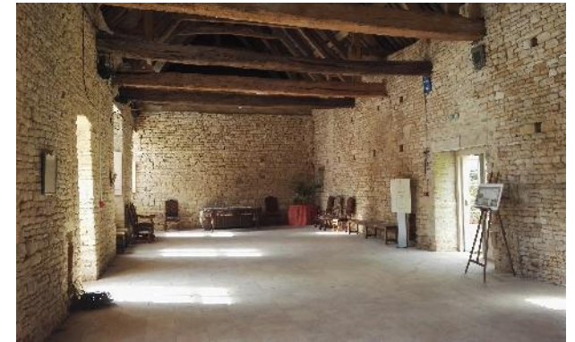
Salle des Gardes