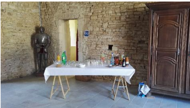
Salon Jean de Vienne